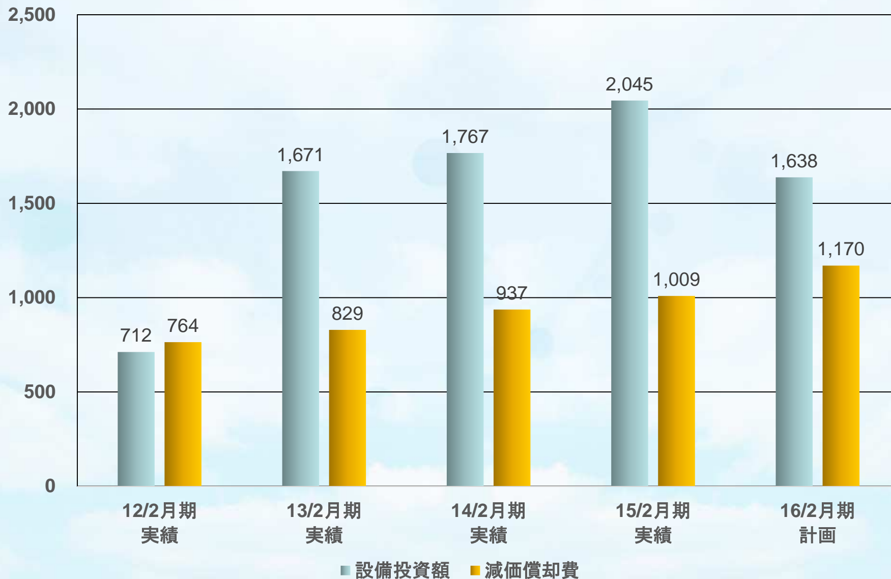
設備投資額・減価償却費の推移（百万円）